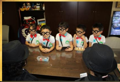
えんちょうせんせいのへや