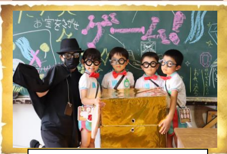
ぎほうしょうがっこう