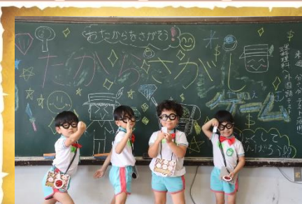
ぎほうしょうがっこう