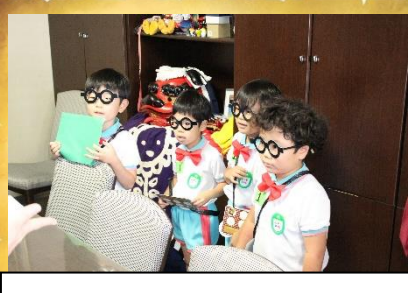
えんちょうせんせいへのや